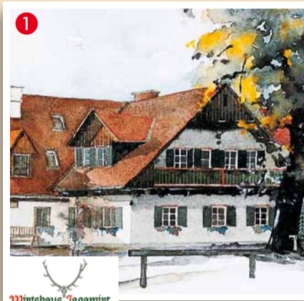
Wirtshaus Jagawirt Sommereben 2, A-8511 St. Stefan Tel. 03143/8105, Fax: 03143/8105-4 www.jagawirt.at