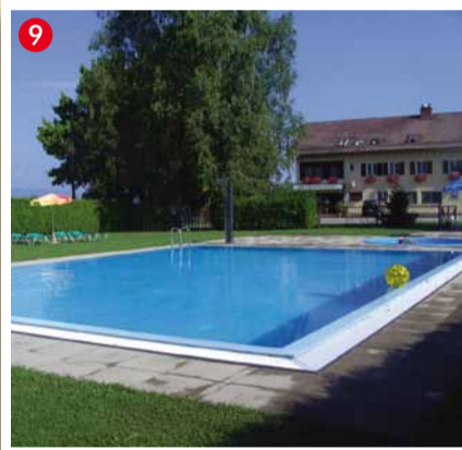
Gasthof Martinhof A-8543 St. Martin im Sulmtal, Oberhart 53 Tel. 03465/2469, Fax: 03465/7064 www.martinhof.at