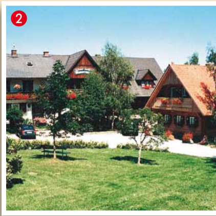
Bioalm Wassermann-Wirt A-8511 Reinischkogel 8 Tel: 03143/8113, Fax: 03143/8113-4 www.wassermann-wirt.at

Lassen Sie die Seele baumeln und genießen Sie unvergessliche Tage bei uns im Schilcherland!