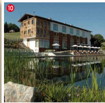
IWEIN**** Hotel | Bar | Bistro A-8552 Eibiswald 120 Tel. 03466/43221, Fax: 03466/43221-96 www.iwein.at