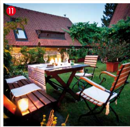
Hasewend's Kirchenwirt A-8552 Eibiswald, Nr. 39 Tel. 03466/42216, Fax: 03466/42216-4 www.hasewend.at

An unserer Wein.Lounge-Bar im Wintergarten erwarten Sie die heimischen Produkte: Wein, Edelbrände und steirischer Whisky aus der Süd-West-Steiermark. Unser Bistro bietet gehobene steirische und österreichische Küche.