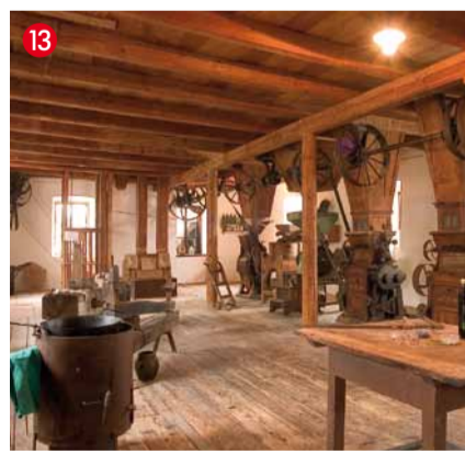
Ölmühle Hartlieb A-8451 Heimschuh 107 Tel. 03452/82551-0, Fax: 03452/82551-51 www.hartlieb.at

Im über 600 Jahre alten ehemaligen Schlosskeller finden immer wieder neben Geburtstags- und Betriebsfeiern hoch qualifizierte Kulturveranstaltungen wie Lesungen und Konzerte statt.