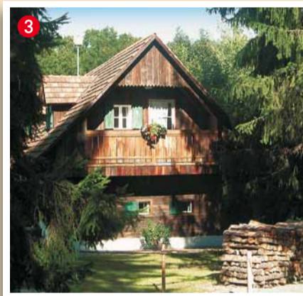
Rauch-Hof A-8510 Stainz, Wald 21 Tel. 03463/2882, Fax: 03463/2882-4 www.rauch-hof.at

In wunderbarer Idylle liegt unser Gasthof am Reinischkogel. Er befindet sich seit sieben Generationen im Familienbesitz. Die angeschlossene Landwirtschaft sowie das Weingut ermöglichen uns, für unsere Gäste den Großteil der Grundprodukte selbst zu erzeugen. Auf etwa zehn Hektar Wiesen weiden Hirsche, die sich ihre Äsung selbst suchen und Bio-Fleisch in die Gasthausküche liefern. Unser Fischteich bringt uns herrliche Regenbogenforellen. Der Schilcherweinbau mit seinen Erzeugnissen ist ein unverzichtbarer Bestandteil unseres Familienbetriebes. Perfekt ausgestattete Bio-Komfortzimmer garantieren Ihnen einen erholsamen Urlaub.