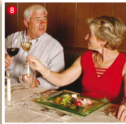
Ferienhotel Berghof-Vital A-8542 Aigneregg 22 Tel. 03467/8469, Fax: 03467/8469-9 www.berghof-vital.at

Aktuelle Packages unter www.mauthners.at