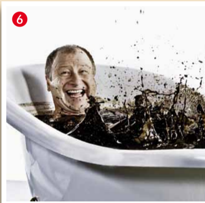
Heilmoorbad im Kloster Schwanberg Hauptplatz 1, A-8541 Schwanberg Tel. 03467/8217, Fax: 03467/8217-70 www.heilmoorbad.at

Öffnungszeiten: Montag bis Samstag 7 Uhr bis 22 Uhr – Für Reisegruppen auch sonntags mit Anmeldung