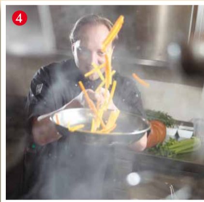
Hotel Restaurant STAINZERHOF**** Grazier Straße 2, A-8510 Stainz, Tel. 3463/22122, Fax: 3463/22122122 www.stainzerhof.at

Genuss und Erholung pur im Herzen des Schilcherlandes. Mit dem gepflegten und weitläufigen Freizeitbereich (großer Naturbadeteich mit Kinderstrand, Sandtennisplätze, Beachvolleyball, Flussbad, Kneippstrecke, Spiel- und Liegewiesen) entdeckt man hier eine harmonische Erlebniswelt, die natürlich auch ihre kulinarischen Seiten hat. Frische Forellen kommen aus eigenen Teichen, Spargel, Kürbisse und anderes Gemüse vom großen Gemüsegarten hinter dem Haus. Kulturwirtshaus – Spezialitätenrestaurant – familienfreundlicher Feriengasthof und das stilvolle Schlosscafé im prachtvollen Erzherzog Johann-Schloss Stainz. Der Rauch-Hof hat viele Gesichter, die es zu entdecken gilt. Überzeugen Sie sich selbst davon!