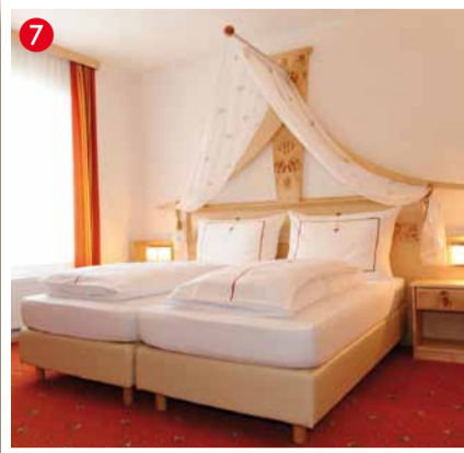
Hotel-Fleischerei-Gasthof „Zur alten Post“ A-8541 Schwanberg, Hauptplatz 20 Tel. 03467/8264, Fax: 03467/72440 www.mauthners.at